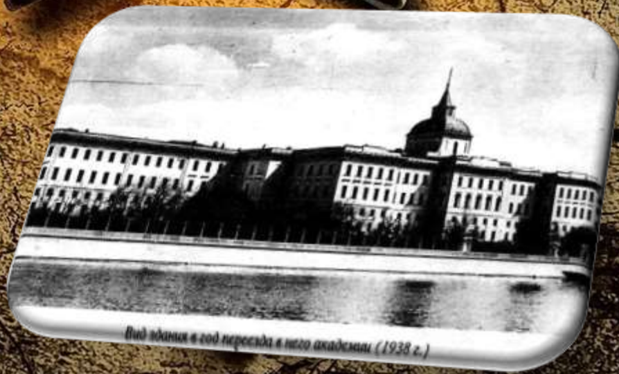
Вид здания в год переезда в него академии (1938 г.)