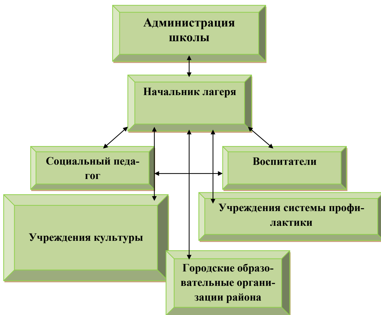
Схема управления программой