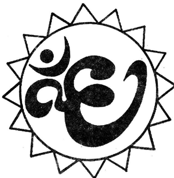
Рисунок для фиксации глаз

Вариант 3. Вокруг знака проведена окружность. Перемещайте свой взгляд по окружности, двигая одновременно глаза и голову. Делайте упражнение вначале с открытыми глазами, затем с закрытыми, представляя окружность.